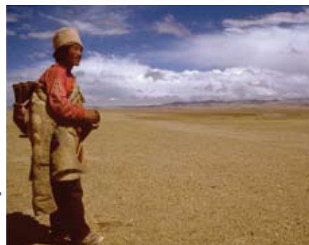
Nomad on the grasslands of Tibet.

Realiteit: de baby – en kindersterfte in Tibet blijven bij de hoogste van de wereld.