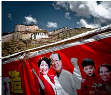
Chinese propaganda at Dzong Monastery, Gyantse, Tibet.

In oktober 2010 protesteerden meer dan 10.000 Tibetaanse studenten en leraars tegen de nieuwe opleidingshervormingen door de provinciale overheid van Qinghai, die er op gericht waren de basis- informatie en communicatie nog enkel in het Chinees te laten gebeuren.(6d) Straatborden,- tekens, en officiële documenten zijn enkel nog uitsluitend in de Chinese taal, brieven die geschreven werden in het Tibetaans worden niet meer besteld. Ondanks alle inspanningen van de Chinese overheid is er een herleving van de Tibetaanse taal als een expressie van hun cultuur en identiteit op komst.(6e)