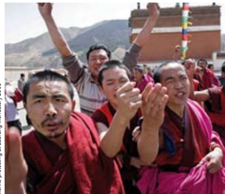
Monks protesting at Labrang Monastery 2008

Realiteit: Sinds de Chinese bezetting, ligt het Tibetaans Boeddhisme zwaar onder vuur en probeert de Chinese overheid de kern ervan te vernietigen, met name de loyaliteit tegenover de Dalai Lama. Er werden door de Chinese overheid bij benadering 6000 boeddhistische kloosters vernietigd . Vandaag is het aantal nonnen en monniken zeer sterk gereduceerd, worden religieuze instituten onderworpen aan strenge controles en worden de geestelijken naar "heropvoedingskampen"gestuurd.(9 b) In april 2011 werden 300 protesterende monniken afgevoerd uit het Kirti klooster in Oost -Tibet.(9c) In 1995 werd de toen 6-jarige Gedhun Choekyi Nyima, de door de Dalai Lama aangeduide 11de Panchen Lama, ontvoerd. Tot op vandaag weet men niets